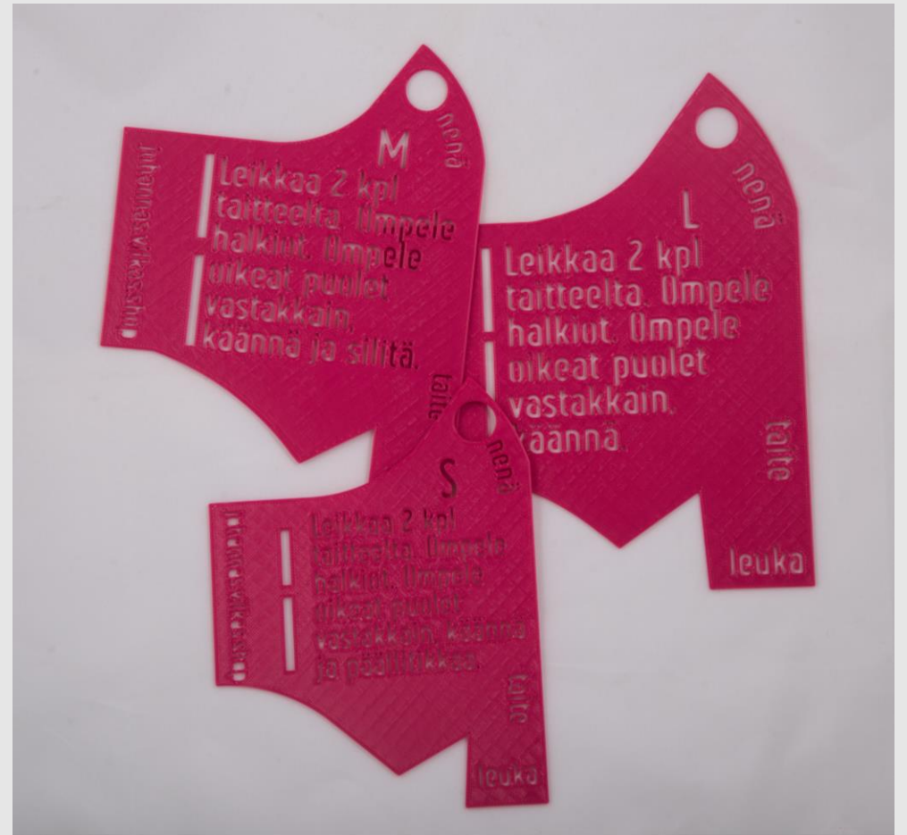
Maskikaava, jossa kolme eri kokoista kaavaa samassa (tuote 1)